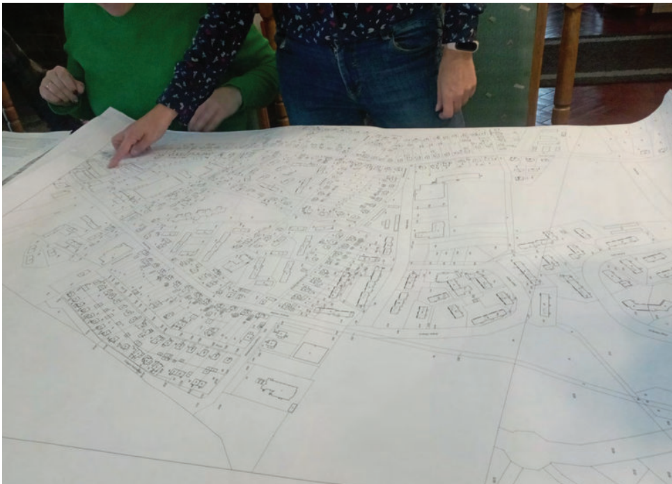
Członkowie grupy na Facebook "PIONIER - stop podwyżkom" opracowują w wolnym czasie mapę cen ciepła po podwyżkach, którą przedstawili na spotkaniu z Dariuszem Powroźnikiem w dniu 30 października br.

wydłuża ją o kolejne tygodnie. Tego rodzaju procesy sądowe są bardzo praco jak i czasochłonne, a pytani przez nas eksperci rokują, że proces może trwać co najmniej 2-3 lata.