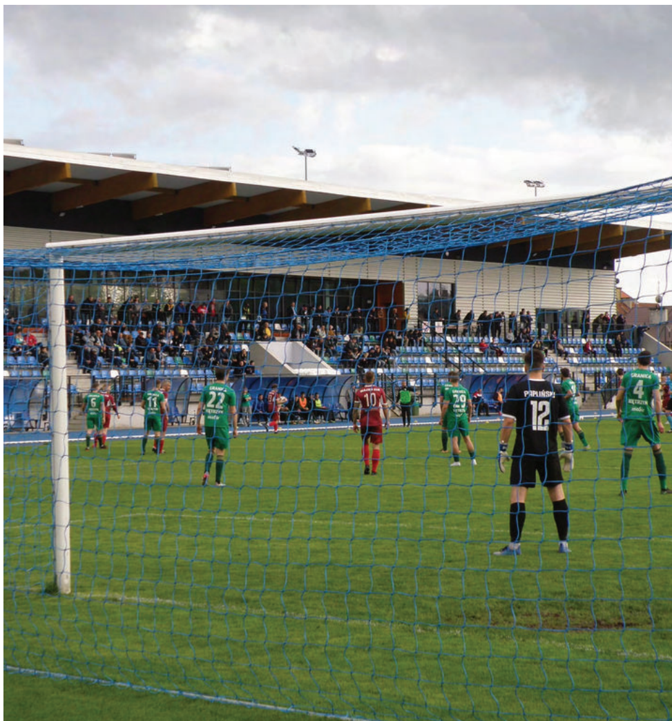
Tabela forBET IV ligi po 10.kolejkach