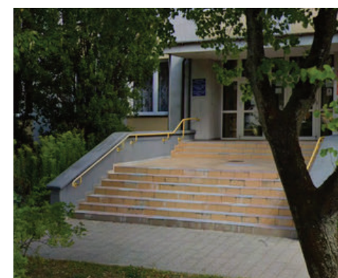
zdjęcie na górze pokazuje obecny wygląd schodów przy ZS w Kętrzynie, zdjęcie na dole jak wcześniej wyglądały schody

W ostatnim czasie starosta kętrzyński pochwalił się w mediach społecznościowych kolejną zrealizowaną inwestycją – a dotyczy to remontu kilku schodków prowadzący do wejścia Zespołu Szkół im. Marii Skłodowskiej-Curie w Kętrzynie. Jak czytamy we wpisie: „jest estetycznie i bezpiecznie. Dziękuję wykonawcy, firmie Karol Szymon Siłkowski "ARS". Projekt jest częścią zadania modernizacyjnego placówek oświatowych w Powiat Kętrzyński. Wartość kontraktu to 1 320 000 zł.”